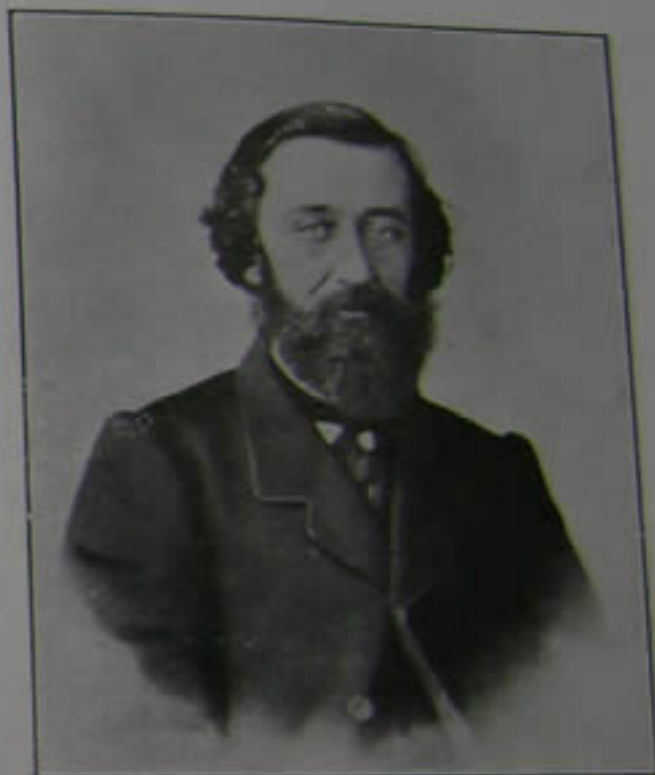
JUAN CARLOS GÓMEZ. Retrato inédito.

nes de sitios y paisajes de juventud—cosas lejanas, maravillosas hijas del Tiempo y de la Ausencia—que yo—referidas a mis calientes queridas tierras salteñas, he visto tanto con los ojos del alma.