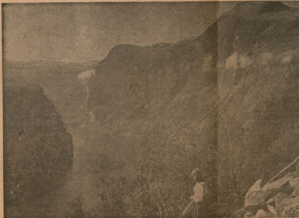
UN FIORDO NORUEGO. — Desde Oslo hasta el extremo norte, toda la costa de Noruega ofrece el espectáculo de los fiordos.

Comparativamente los uruguayos somos uno de los pueblos del mundo, que más intensamente viaja. Y además, es prudente anotar que somos un pueblo que sabe observar y aprender. A este espíritu de viajeros inquietos, debemos fundamentalmente buena parte de nuestro desarrollo social y