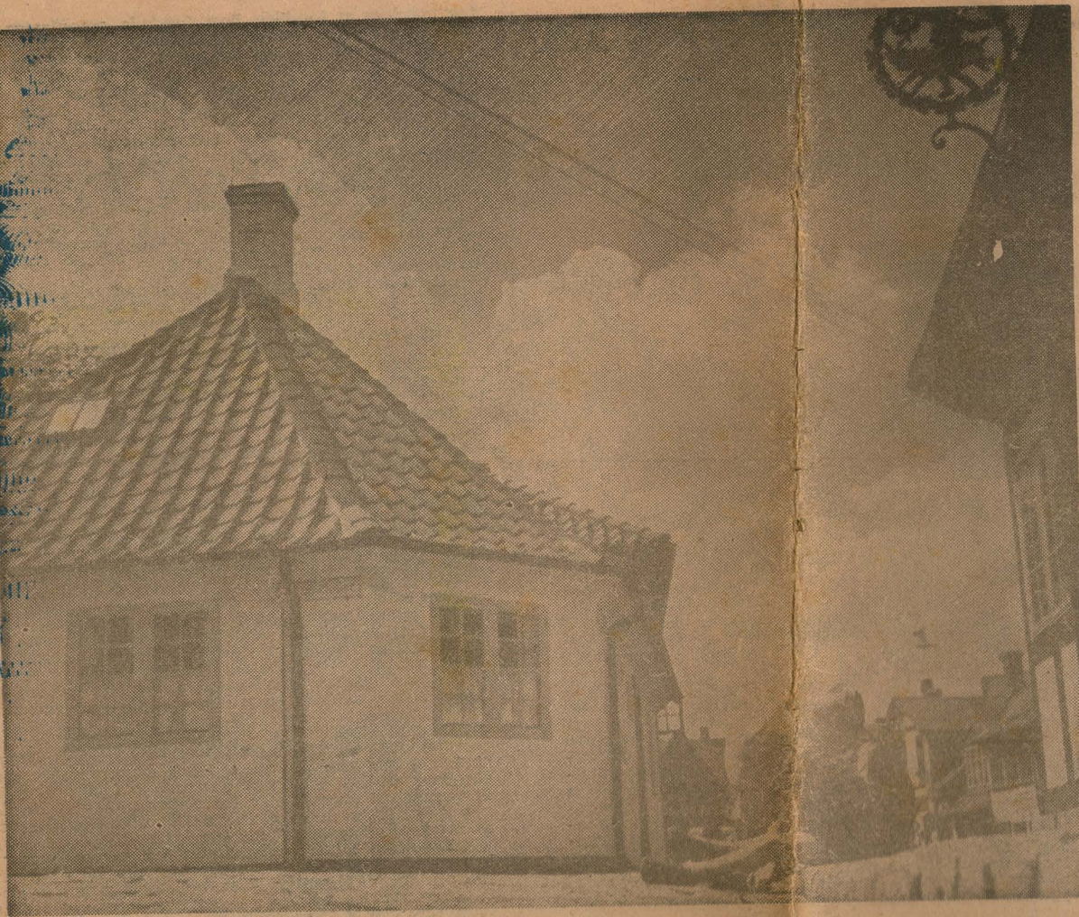
ODENSE, DINAMARCA. — En esta casita, que parece arrancada de uno de sus cuentos, vivió Hans Christian Andersen.