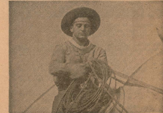
El rudo trabajo del hombre de campo será fielmente reflejado en el documental de SAS sobre la ganadería uruguayana.

SAS ha solicitado el asesoramiento técnico de organizaciones y destacados ganaderos uruguayos así como la colaboración del Ministerio de Ganadería, Comisión Nacional de Turismo y otras autoridades nacionales.