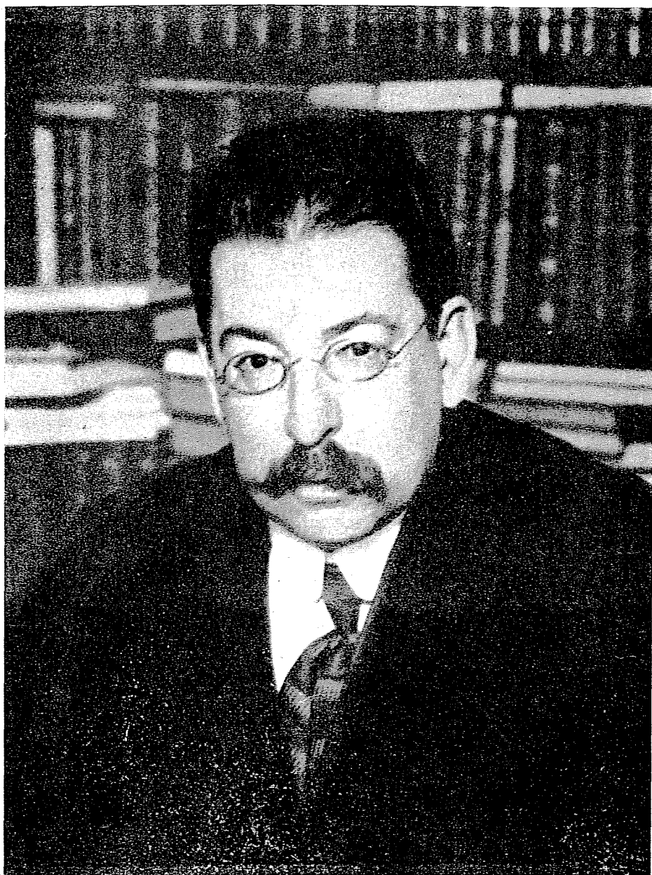
JOSE ENRIQUE RODO

N. en Montevideo el 15 de julio de 1871; m. en Palermo el 1º de mayo de 1917. Original de la fotografía reproducida en "Crítica" el 14 de febrero de 1914. Rodó tenía entonces 42 años.