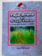
Portada de la primera edición gallega de la obra de Alonso y Trelles, de próxima aparición.

Esta visión realista y negativa de la vida del gaucha va a ser retomada en el segundo gran momento de la poesía gauchesca, que podemos ubicar en la década de 1870, cuando publican sus obras mayores el uruguayo Antonio D. Lussich ( Los tres gauchos orientales , 1872) y los argentinos Hilario Ascasubi (esp. Panlino Lucero y Santos Vega , 1875) y José Hernández. Este último fue el autor de la obra cumbre del género, Martin Fierro , publicada en dos partes, en 1872 y 1879. Una meta común de estos autores fue la defensa del gaucha, que habiendo sido soldado fiel y carne de cañón durante las guerras civiles, estaba en vías de extinción gra-