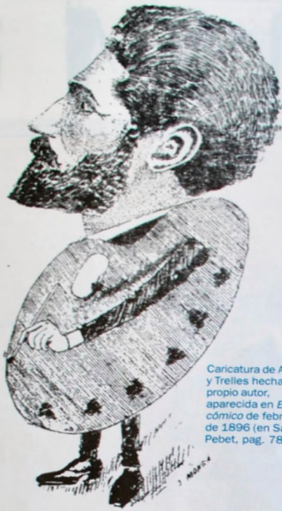
Caricatura de Alonso y Trelles hecha por el propio autor, aparecida en El Tala cómico de febrero 9 de 1896 (en Sabat Pebet, pag. 78)