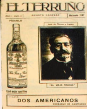
Portada de El Terruño , Año I, N.º 4, octubre de 1917, con foto de Alonso y Trelles.

En 'Remordimientos' (1ª ed., s. f.) el gaucho pide perdón a la china por haberle cortado la trenza en 'Resolución' (1899). El poeta recuerda la ocasión en que volvió a ver a la china que había