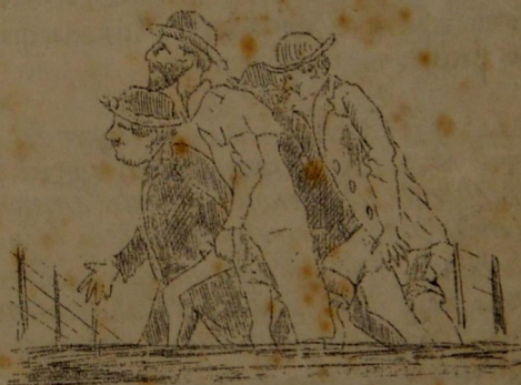
A LA IDA

En espasmos de ardiente nerviosismo apagar para siempre este sed mia, y probarle despues que el que juraba que te habia de amar siempre, le mentía