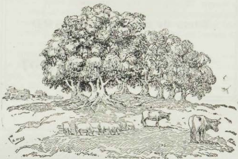
Los «Ombuses del Alto Grande» son siete y son enormes;...

Entre los Ombúes y la Azotea, en punto perfectamente equidistante, estaba situada la « Madriguera de los Acosta », ranchería que aunque poblada por seres de carne y hueso y perfectamente conocidos no escapaban al ambiente macabro, que expandían por el contorno las ruinas mencionadas.