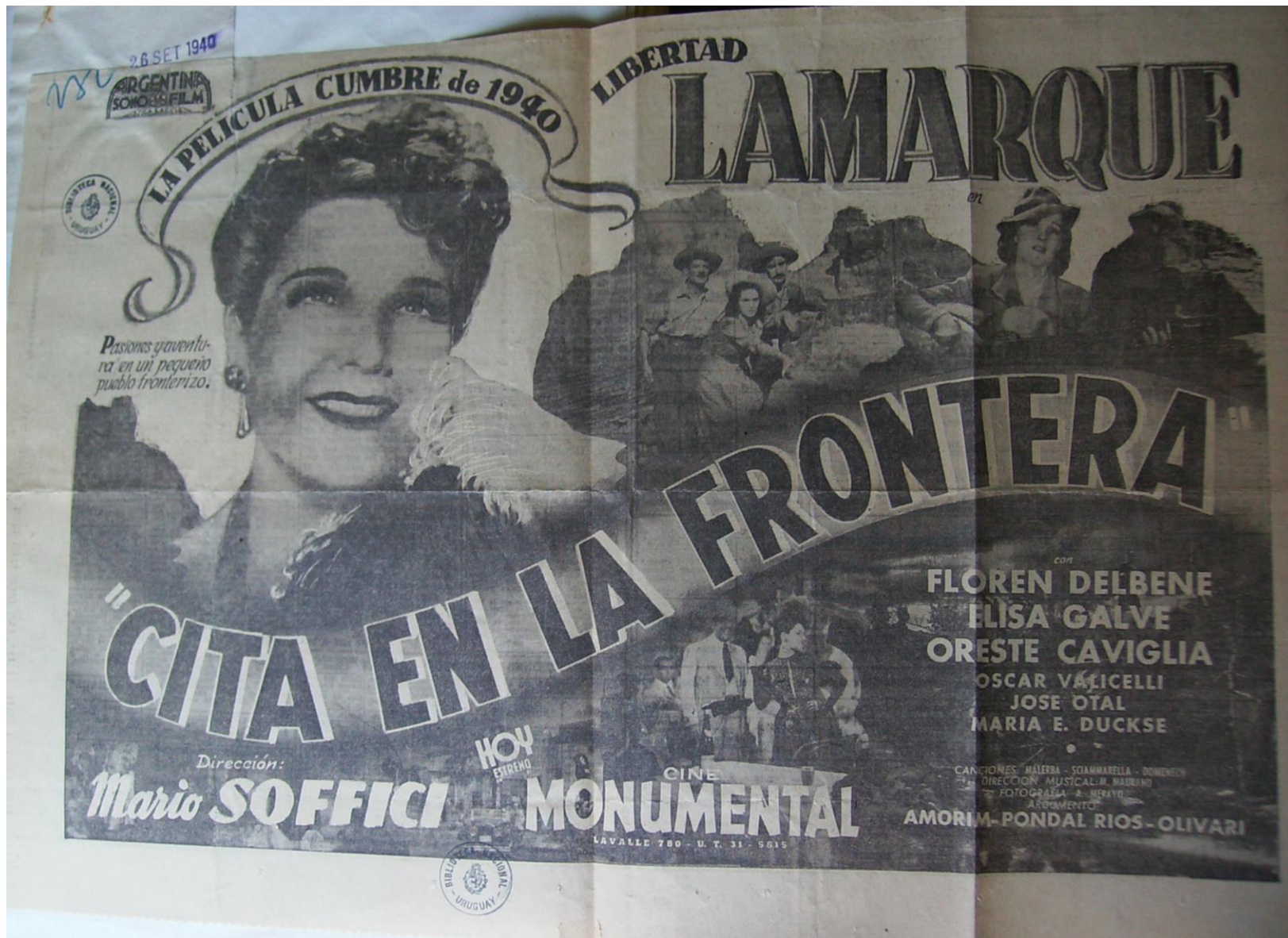
Afiche de la misma película. Setiembre 1940