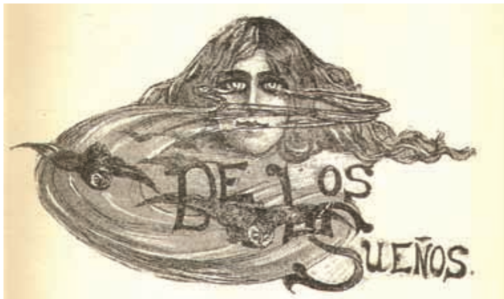
José León Pagano. Ilustración incluida en Gesta , de Alberto Ghirardo, Buenos Aires, Edición de “El Sol”, 1900, 173 x 112 mm. (Colección MLR).

Respecto de la calidad de edición de La raza de Caín , libro que Reyles escribe influido por Zola, hemos de señalar que la misma nos habla de la importancia dada a la ilustración por su autor, quien había realizado un viaje a París hacia 1897, reflejando en sus relatos El extraño (1897) y Sueño de rapiña (1898) su sensibilidad decadentista que luego, con el concurso de Bosco, establecería en aquella obra. Reyles sería autor también de una de las obras mejor editadas en la Argentina en el primer tercio de siglo, los dos tomos (iban a ser tres) de los Diálogos Olímpicos , ilustrados por Gregorio López Naguil entre 1918 y 1919, del que hablaremos más adelante. Podemos aquí traer a colación a otro escritor antes citado, Alberto del Solar, quien recurriría a Rodolfo Franco, de trayectoria con paralelismos respecto