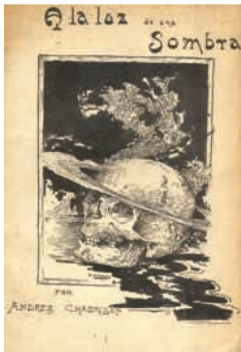
Deolindo Machado. Cubierta de A la luz de una sombra , de Andrés Chabrillón, Buenos Aires ?, Herculano, 1911, 229 x 155 mm. (Colección MLR).

En el primer lustro que va desde la celebración del Centenario hasta el arribo paulatino de artistas como López Naguil, Boveri o Pinto, de quienes ya vimos como a partir de entonces emergieron como ilustradores simbolistas, en Buenos Aires se publicaron algunos libros que nos sirven para entender la presencia de esos lineamientos previo al arribo de aquellos. Entre los circulados