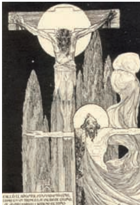
Atilio Boveri. Ilustración incluida en Oración al poeta , de Horacio B. Oyhanarte, Buenos Aires, Talleres Gráficos Rodríguez Giles, 1916, 224 x 174 mm. (Colección MLR).

La fortuna de este imaginario respondía en buena medida a la fascinación causada por Las mil y una noches (divulgada en Europa a partir del siglo XVIII), llave que sirvió para abrir las puertas hacia Oriente a través de idealizadas representaciones. En Iberoamérica, esta difusión se dio especialmente en el primer tercio del XX, teniendo papel esencial las corrientes simbolistas -literarias y artísticas-, que asimilaron y divulgaron aquel imaginario pleno de misterios. Concretamente en la Argentina, además de López Naguil, hubo otros artistas que cultivaron el orientalismo en sus ilustraciones, como se aprecia en las páginas de Plus Ultra , sobresaliendo varios españoles radicados en el país como el asturiano Alejandro Sirio, el gallego Juan Carlos Alonso y el catalán Luis Macaya, y otros como los argentinos Juan Carlos Huergo y Rodolfo Franco (también activo en Mallorca en la segunda década del XX). Jorge Larco cultivaría de manera más prolongada el género, tanto en témperas como en dibujos y aguafuertes, en este último caso con tardías expresiones como las 13 que realizó para "El Bibliófilo" Editor en 1937 (además de siete viñetas) para una edición limitada de 100 ejemplares de Las alegorías de «Salomé» de Mariano de Vedia y Mitre.