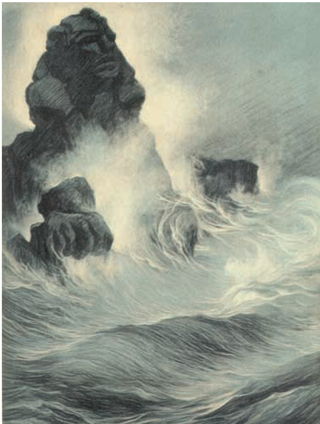
Pío Collivadino. Ilustración incluida en El océano y el firmamento , de Alberto del Solar, Buenos Aires, Arnoldo Moen y Hno. Editores, 1908, 320 x 230 mm. (Colección MLR).

aunque no exentos en algún caso del toque simbolista, sí marcan un creciente interés en la edición cualificada, en este caso a cargo de los talleres de la Casa Jacobo Peuser, en actitud que sería una constante en sus publicaciones. Este cuidado se reflejaría en varios álbumes aparecidos a raíz del Centenario.