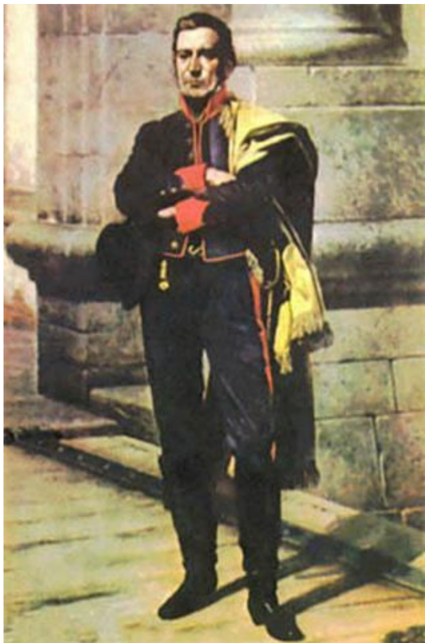
GENERAL JOSÉ GERVASIO ARTIGAS LAS PUERTAS DE LA CIUADELA DE SAN FELIPE Y SANTIAGO DE MONTEVIDEO ÓLEO DE JUAN MANUEL BLANES